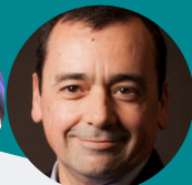
Gameiro Marques Autoridade Nacional de Segurança