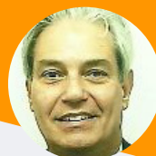
Samuel Silva Birds Trees