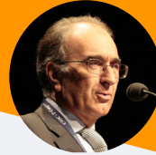
Pinheiro Pinto PP Consultores