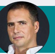
Ricardo Araújo Pereira Humorista

Seja na rádio, nos livros, na imprensa, nos estádios ou na televisão, RAP é companhia assídua de todos os portugueses há vários anos. Numa perspetiva completamente fora da caixa, o humorista contará a sua jornada de inegável sucesso e fará os contabilistas certificados refletirem, debaterem e rirem sobre os mais variados aspetos da profissão.